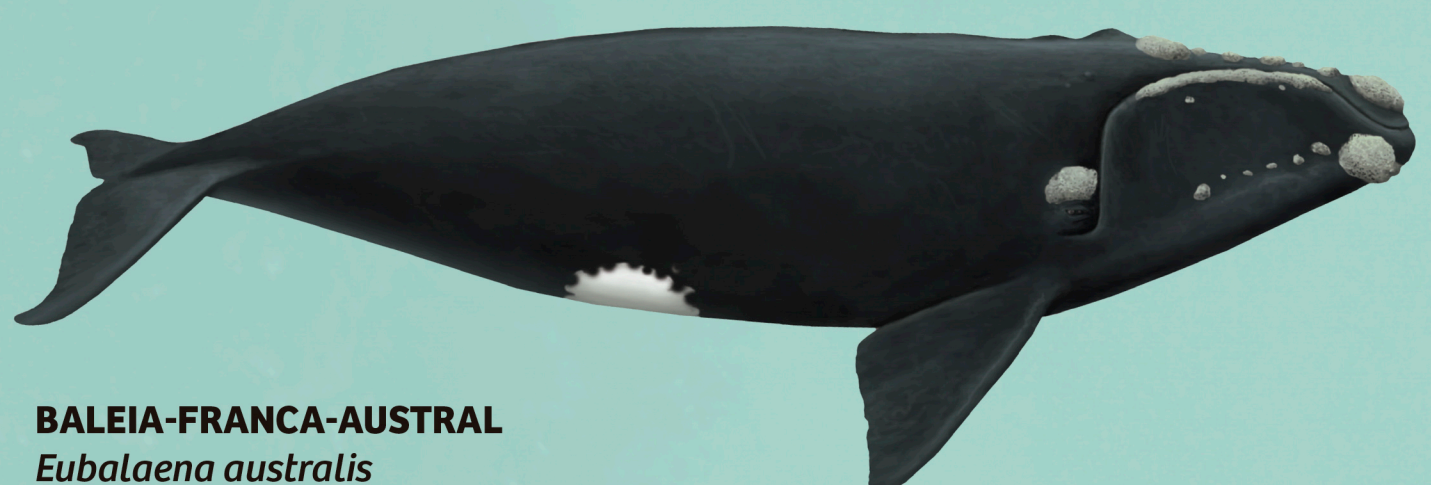
BALEIA-FRANCA-AUSTRAL Eubalaena australis