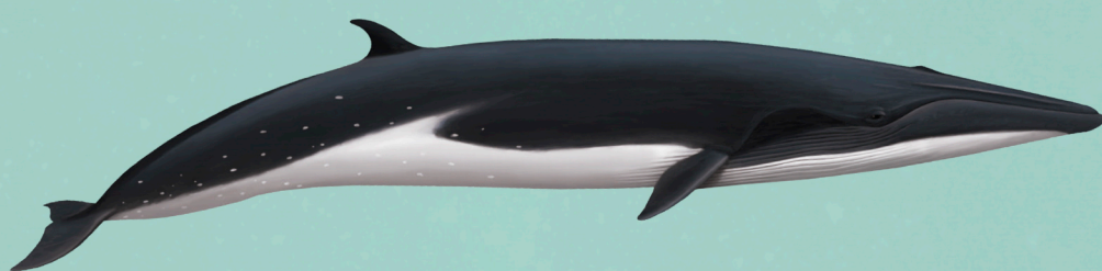
BALEIA-DE-BRYDE Balaenoptera brydei