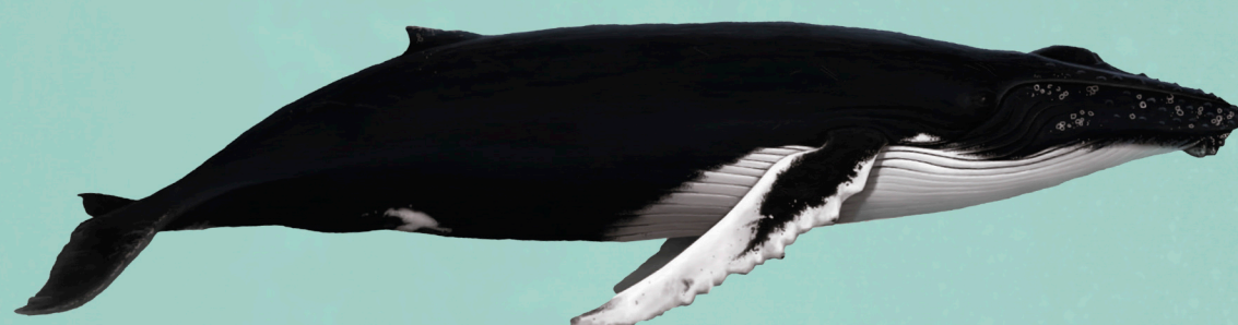
BALEIA-JUBARTE Megaptera nouaeangliae